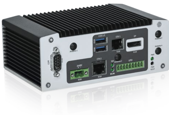
Konfigurierbare IoT-Gateways wie die Kontron KBox A-250 können als Plattform für den Betrieb von FabEagle®Connect eingesetzt werden.

Die Anbindung auch älterer Maschinen in Monitoring-, MES- oder Cloud-Lösungen erfolgt im FabEagle®-Konzept über ein konfigurierbares IoT-Gateway, das die Kommunikation mit übergeordneten Systemen übernimmt. Meist sind zusätzliche Sensoren nötig, die ebenfalls gleich über das Gateway mit einbezogen werden, beispielsweise Strom- oder Temperaturmesser. So lässt sich unter anderem der Status der Maschine bestimmen und feststellen, welche Prozessparameter vorherrschen. Über eine Anwendung können dabei mehrere Connections laufen – zum Beispiel lassen sich die Daten aus fünf Maschinen zugleich in eine Cloud-Anwendung liefern. In der Praxis werden dann beispielsweise Sensorsignale so bereitgestellt, dass ein MES-System in Echtzeit Informationen über Maschinenzustände und Teilarbeitsschritte wie „Teil eingelegt“, „Tür geschlossen“ oder „Teil entnommen“ erhält, um noch detaillierter zu planen.